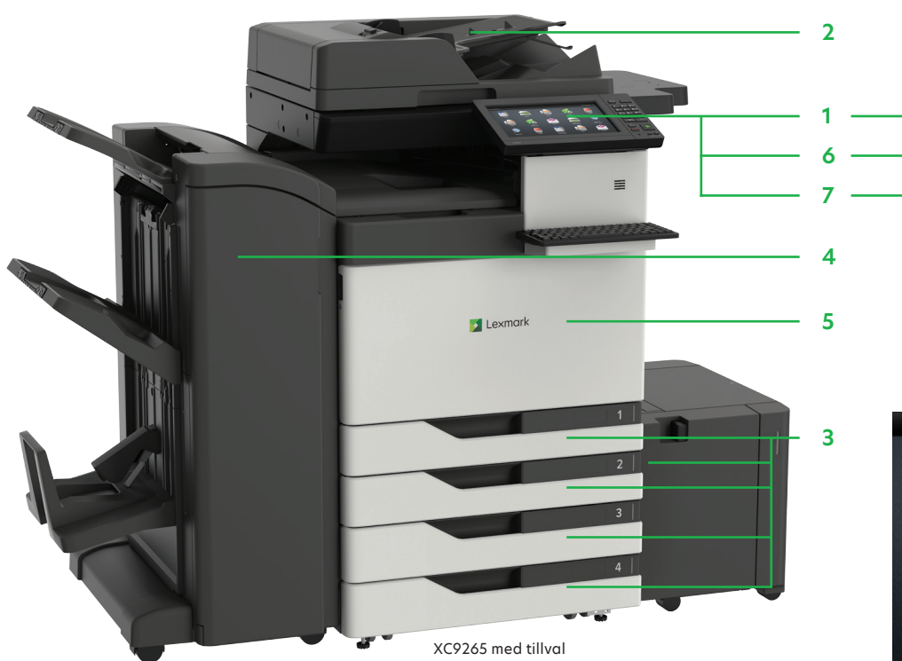
XC9265 med tillval

Skriv ut Microsoft Office-filer, PDF:er och andra dokument och bildtyper från flashenheter eller markera och skriv ut dokument från nätverksservrar eller lagringsutrymmen online.